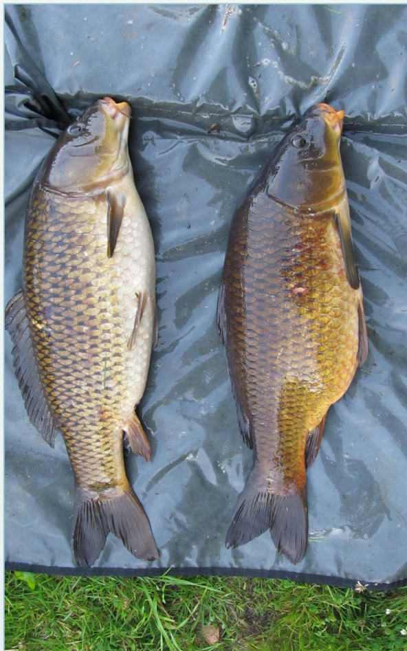
To karper tatt i en lokalitet i Akershus, som veide henholdsvis 4,350 og 4,600 kg.

tette bestander kan den stagnere på 2-300 gram, mot 2-6 kg i lokaliteter med tynne bestander. Den gyter på dagtid i mai-juni når temperaturen i vannet har steget til 17-20 grader. Gytingen varer ca. 4 timer, og den får da livlige, lyse farger. Eggene fester seg til vannplanter og klekker etter 2-8 døgn, avhengig av vanntemperaturen. Yngelen fester seg til vannplanter inntil plommesekken er fortært etter 4-10 døgn. Arten er seiglivet og tåler oksygenfattig vann.